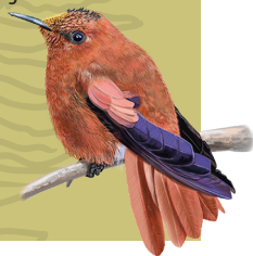
Figura 2: Lista de participantes en el Primer Encuentro sobre Especies Invasoras y Áreas Protegidas.

Áreas Silvestres Protegidas: Hacienda El Durazno Oasis La Campana Parque Huinay Parque Nacional Galápagos, Ecuador Parque Nacional Lanín, Argentina Parque Oncol Reserva Corral del Agua Reserva Costera Valdiviana Reserva Biológica Huilo Huilo Santuario Altos de Cantillana Santuario Cascada de las Ánimas Santuario de la Naturaleza San Francisco de Lagunillas y Quillayal Santuario El Cañi Santuario Laguna Conchal