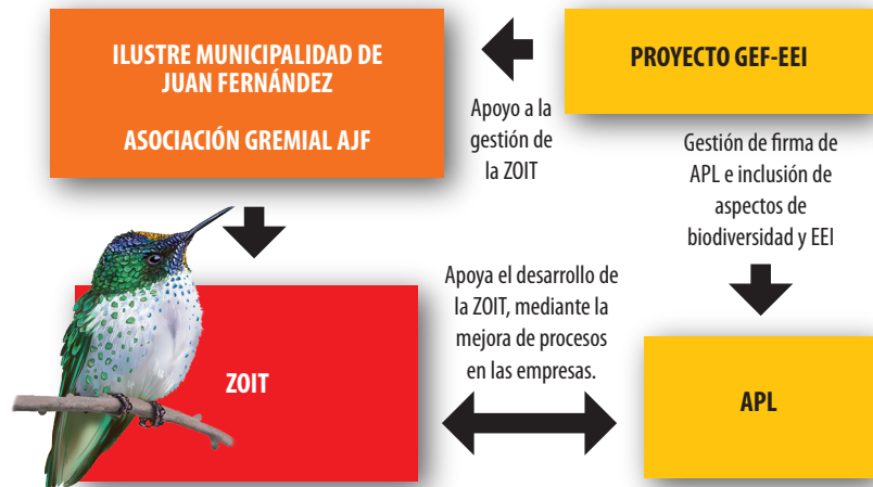
Figura 3: Apoyo del proyecto a la articulación de los instrumentos APL y ZOIT.

La manera en que se materializó la articulación de instrumentos se encuentra representada en la Figura 3, donde el proyecto inicia junto a la Asociación de Turismo las gestiones para realizar un APL, incluyendo distintos aspectos de conservación de la biodiversidad. Este APL apoya mediante sus acciones parte de los objetivos estratégicos de Sustentabilidad del destino y en el de Capital humano y calidad de la oferta turística del ZOIT, el cual venía desarrollándose por parte de la Municipalidad y el sector de Turismo de la isla y al cual el proyecto también apoyó directamente mediante recursos para ampliar las consultorías llevadas a cabo por la Municipalidad.